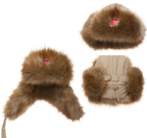
Шапка-ушанка бежевая с искусственным мехом коричневого цвета