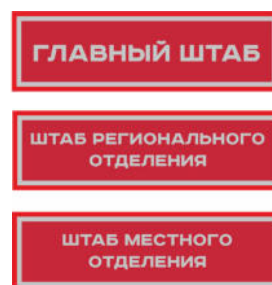
Нарукавный знак, устанавливающий принадлежность к структуре органов ВВПОД «ЮНАРМИЯ»