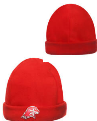
Шапка флисовая вязаная красного цвета