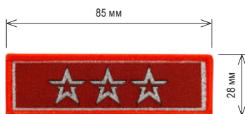
Нарукавный знак, определяющий принадлежность к ВВПОД «ЮНАРМИЯ»