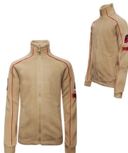
Жакет флисовый бежевого цвета