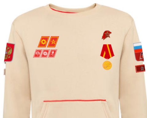
Размещение знаков различия, знаков отличия и иных геральдических знаков на толстовке бежевого цвета