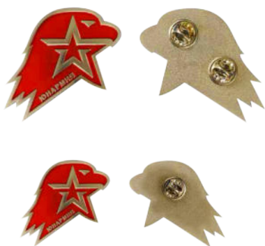
Большая (кокарда) и малая (значок) эмблема ВВПОД «ЮНАРМИЯ»