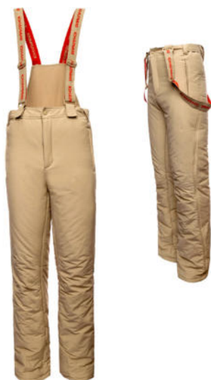
Брюки утеплённые (тактические) бежевого цвета