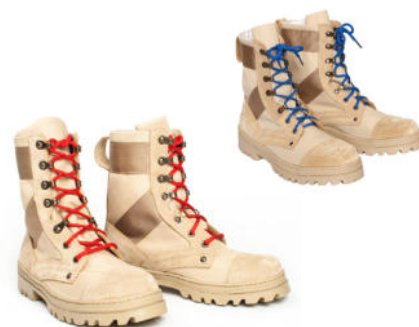
Ботинки с высокими берцами утеплённые бежевого цвета со шнурками красного (синего, бежевого) цвета