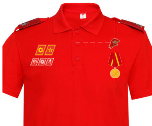
Размещение знаков различия, знаков отличия и иных геральдических знаков на рубашке поло красного (синего) цвета