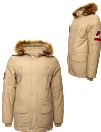
Куртка зимняя утеплённая бежевая с капюшоном и отделкой к капюшону из искусственного меха коричневого цвета